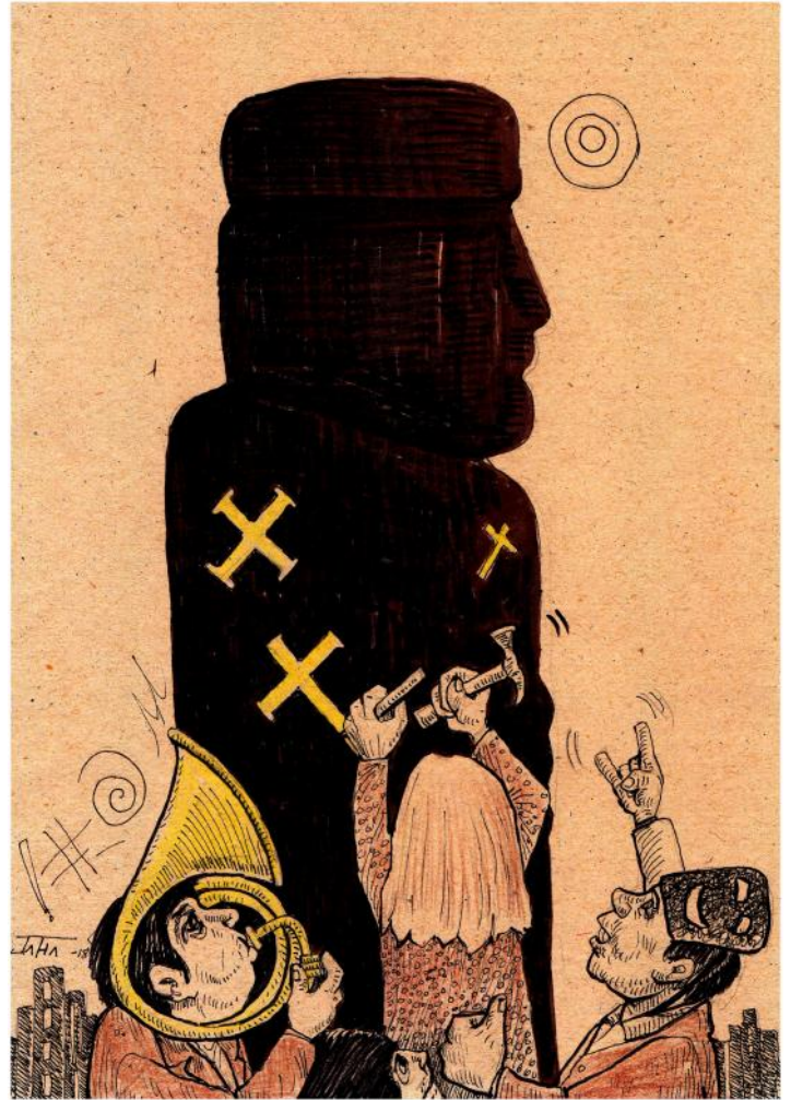
La caricatura de Jatha Wara Waratha: El sincretismo religioso...

«Frente al mundo moderno, signado por la ciencia y la tecnología, pero también por una complejidad creciente y una insolidaridad insoportable, el ethos barroco, asociado inseparablemente al sincretismo y al mestizaje, es percibido ahora como una solución relativamente simple, pero adecuada a las demandas de la población latinoamericana, precisamente porque corresponde a una estructuración social relativamente simple y a un ámbito cultural fácilmente comprensible.»