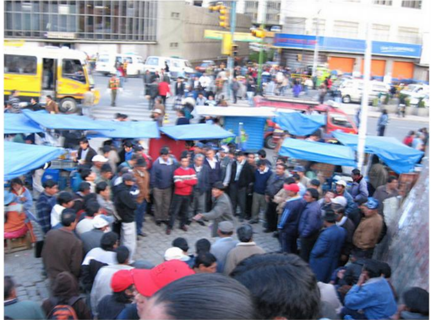
Los debates y mitines que se efectuaban en la Plaza de los Héroes en la ciudad de La Paz, a inicios de la década del año 2000, fue la escuela ideológica popular ajena a las modas intelectuales de la academia y de la clase media; también antecedente directo del actual activismo indianista katarista en las redes electrónicas. Lastimosamente, existe poca referencia sobre ese importante capítulo.

un lugar de encuentro o disputa, también fueron espacios de comerciantes y de humoristas callejeros. También grupos evangélicos se apostaban para predicar su credo, como pasaba en la Plaza de los Héroes. Fue ahí que, en la segunda mitad del año 2000, por primera vez presencié el fenómeno de hablar política con un discurso indianista. Me encontré con gente que discutía sobre la coyuntura y esa práctica era una formación política en vía pública.