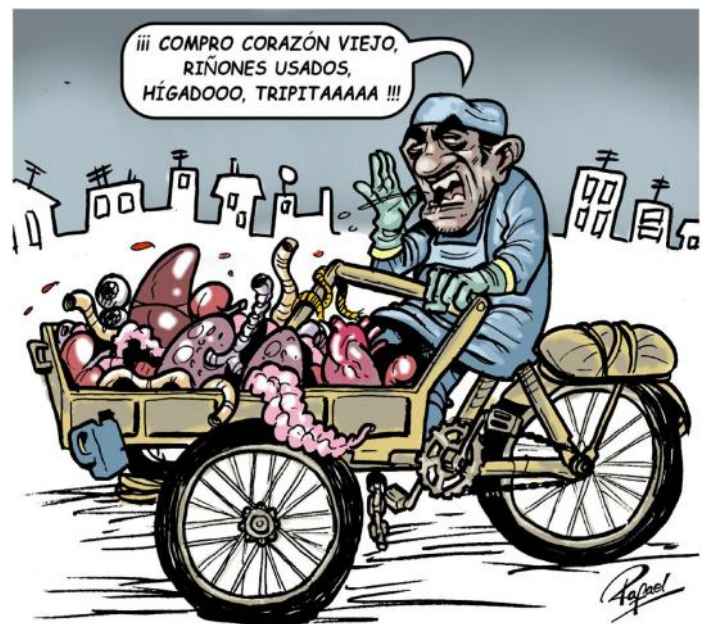
Al ritmo que va nuestra sociedad y siguiendo la tendencia de enaltecer las actividades informales, dentro de poco hasta las profesiones más «nobles» se encaminarán alegremente en ese rumbo.

En el último Informe Nacional sobre Desarrollo Humano en Bolivia elaborado por la PNUD y presentado indica, que, en las dos últimas décadas el surgimiento de profundas transformaciones sociales que ha sufrido Bolivia ha sido quizás la mayor motivación para la realización de